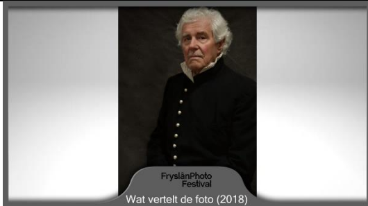
Frysland Photo Festival Wat vertelt de foto (2018)

Dit is een fotoserie rond de vrijwilligers van het Barentszproject. Zij reconstrueren in Harlingen het expeditie-schip van Willem Barentsz. Het zijn stoere bevlogen mannen. Niet om zomaar een portret van te maken. Het moest bijzonder zijn, net als hun project. Ik dacht aan personages uit Barentsz' tijd. En zo kwam als vanzelf de link met het thema van het fotofestival: Wie ben ik.