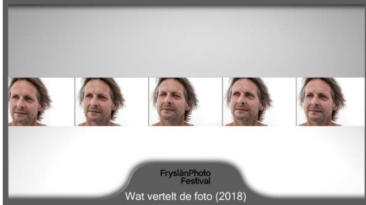
Frysland Photo Festival Wat vertelt de foto (2018)

Wie ben ik? Ik vind het een lastige vraag. Elk antwoord erop lijkt tekort te schieten, is incompleet. Mijn ervaring is dat als er doorgevraagd wordt op deze vraag, er vertwijfeling ontstaat. Niet alleen bij mij maar ook bij anderen. Want wie ben jij? Deze vraag raakt aan een intiem gedeelte van jezelf. Hoe goed ken je jezelf en wat wil en kun je laten zien van jezelf? Deze fotoserie/stopmotion is een vastlegging van wat er non-verbaal gebeurt met de persoon in kwestie, wanneer ik deze vraag stel.